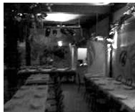
La churrascaria «Pan di Zucchero»

accanto a una serie variegata di ricette appetitose. Durante il weekend, quando il servizio si interrompe, ci si può allenare seguendo le ricette del libro della Cucina Asi (marchio registrato che connota il servizio): questo volumetto, una volta terminato il pacchetto base di due settimane, rimarrà come omaggio per aiutare a mantenere il peso ottenuto con la dieta. Il servizio di catering ipocalorico a domicilio, che è già attivo in otto città d'Italia, funziona con la consegna ogni giorno di una borsa termica che viene recapitata con il menù completo. «È adatta a tutti perché non impone rinunce, non fa «fare la fame» e aiuta a perdere peso - dicono i promotori di Diet To Go - o a mantenerlo se si è già in forma grazie a un piano alimentare corretto ed equilibrato».