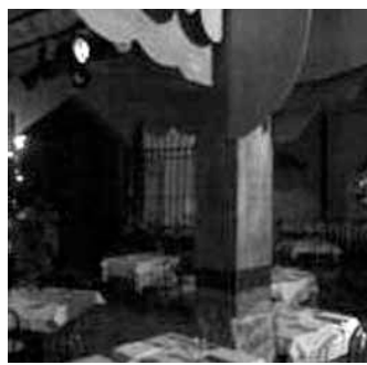
L'interno del «Fra' Patata»

Da fuori è poco più di un immenso capannone, ingentilito dagli alberi, è vero, dalle finiture degli ingressi e dai colori, ma nessuno a vederlo direbbe quali sorprese serba. Cinquecento metri quadrati di superficie unica e due anime distinte: una calda e scatenata, sudamericana, sul lato destro della costruzione, e l'altra, sul lato sinistro, uggiosa, intima, misteriosa come le nebbie di quel lembo di Lomellina al confine col Piemonte. La scatola grande con l'anima doppia è una trovata di un gruppo di imprenditori vercellesi lungo strada circonvallazione a Robbio. Il fronte sudamericano, è stato il primo a venire alla luce. Con un nome inequivocabile, «Pan di zucchero», monumento naturale che è diventato simbolo delle atmosfere brasiliane. E così l'offerta